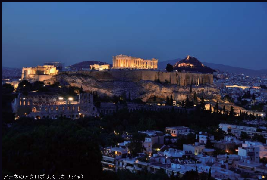
アテネのアクロポリス (ギリシャ)