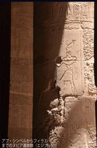
アブ・シンベルからフィラエまでのヌビア遺跡群 (エジプト)