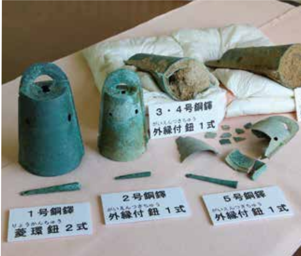
兵庫県南あわじ市松帆地区で見つかった銅鐸(松帆銅鐸)

銅鐸。それは弥生時代に生まれ、そして弥生時代のうちに消えた謎の多い青銅器。 その神秘性だけでなく美しさでも、多くの人々を魅了し、その意味や使用方法の変遷、鑄造技術や生産体制など、さまざまな角度から研究が進められてきました。 二〇一五年の夏、淡路島南あわじ市の松帆地区で奇跡的に発見された銅鐸。それは、内部に音を鳴らすための舌(せつ)を持った「聞く銅鐸」の姿をはっきりと見せてくれました。他にも、樹木などに吊り下げるための「ひも」や、入れ子状態の埋納状況などは、