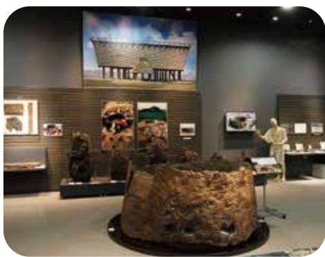
제 2 전시실에서는「이케가미소네 월드」라고 하는 테마로 박물관이 입지해 있는 나라의 사적인 이케가미소네 유적에서 출토된 유물을 전시·소개하고 있습니다.