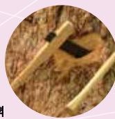
철 도끼의 위력

〈새로운 기술의 탄생〉에서는 「철의 위력」, 「주조의 기술」, 「생활 속의 기술」을 소테마로 한 일본열도의 사람들이 처음으로 경험한 기술혁신의 실재를 소개하고 있습니다.