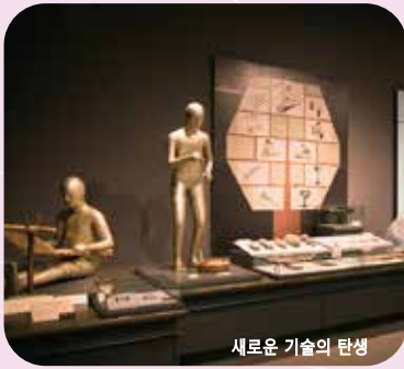
새로운 기술의 탄생

입구의 아치에서는 야요이 문화에 관한 6개의 테마를 소개. 그 앞에는 2000년의 시간을 넘은 야요이 문화의 세계가 펼쳐져 있습니다. 실물 사이즈로 복원된 수혈 주거 안에 야요이인의 가족이 여러분을 맞이합니다.