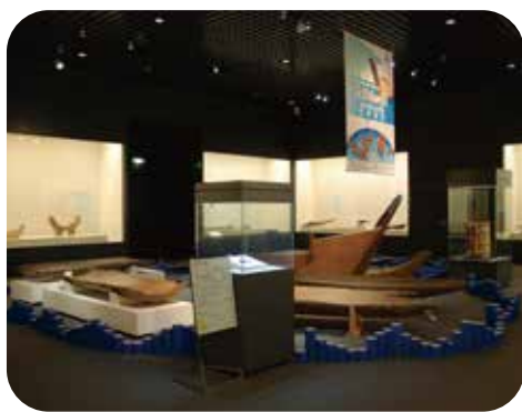
특별 전시실에는 야요이 문화와 관련있는 테마를 설정해 특별전과 기획전등을 한 해 수회에 걸쳐서 개최하고 있습니다.