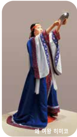
왜 여왕 히미코

야요이 문화에 관한 자료와 정보를 수집·보관·연구·전시하여 야요이 문화를 폭 넓게 접근해 학습하는 것을 목적으로 하고 있습니다. 그 지방의 유적 뿐만 아니라 야요이 문화 전반을 대상으로 하는 전국에서 유일한 박물관입니다.