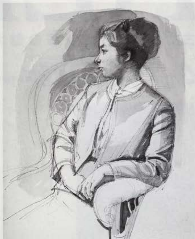
婦人像 1962 水彩、紙・ペン 62.5×50.1