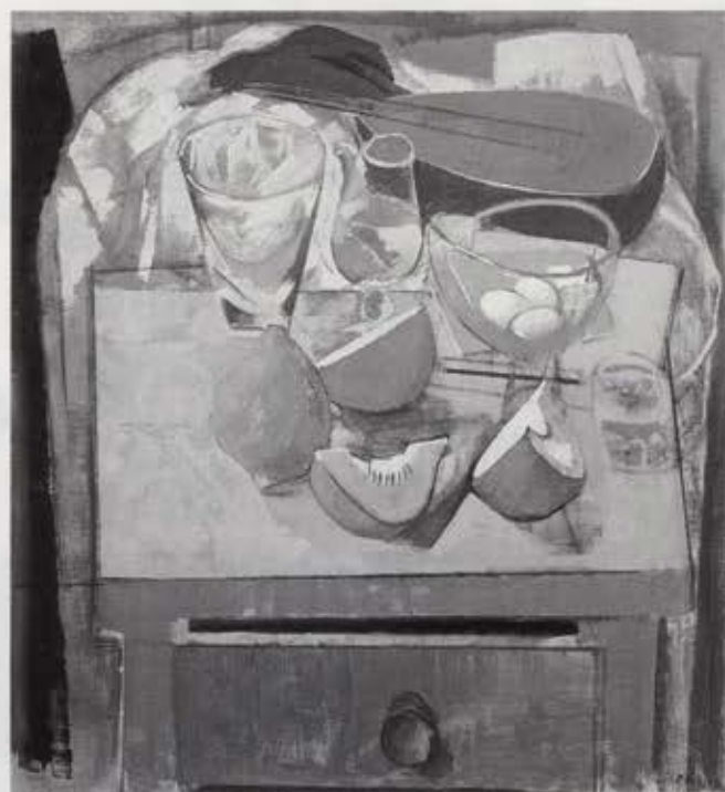
静物 1957 油彩・キャンバス 99.0×91.0