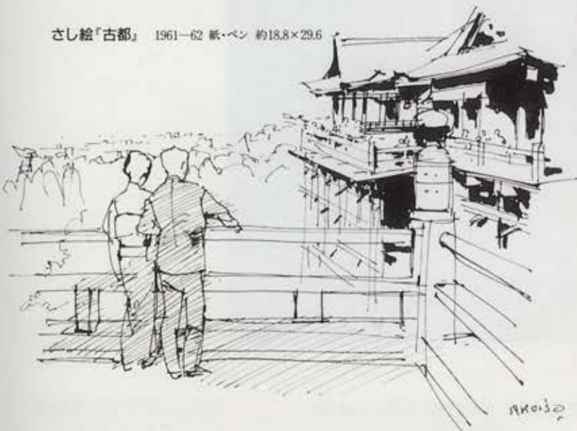
さし絵『古都』 1961-62 紙・ペン 約18.8×29.6