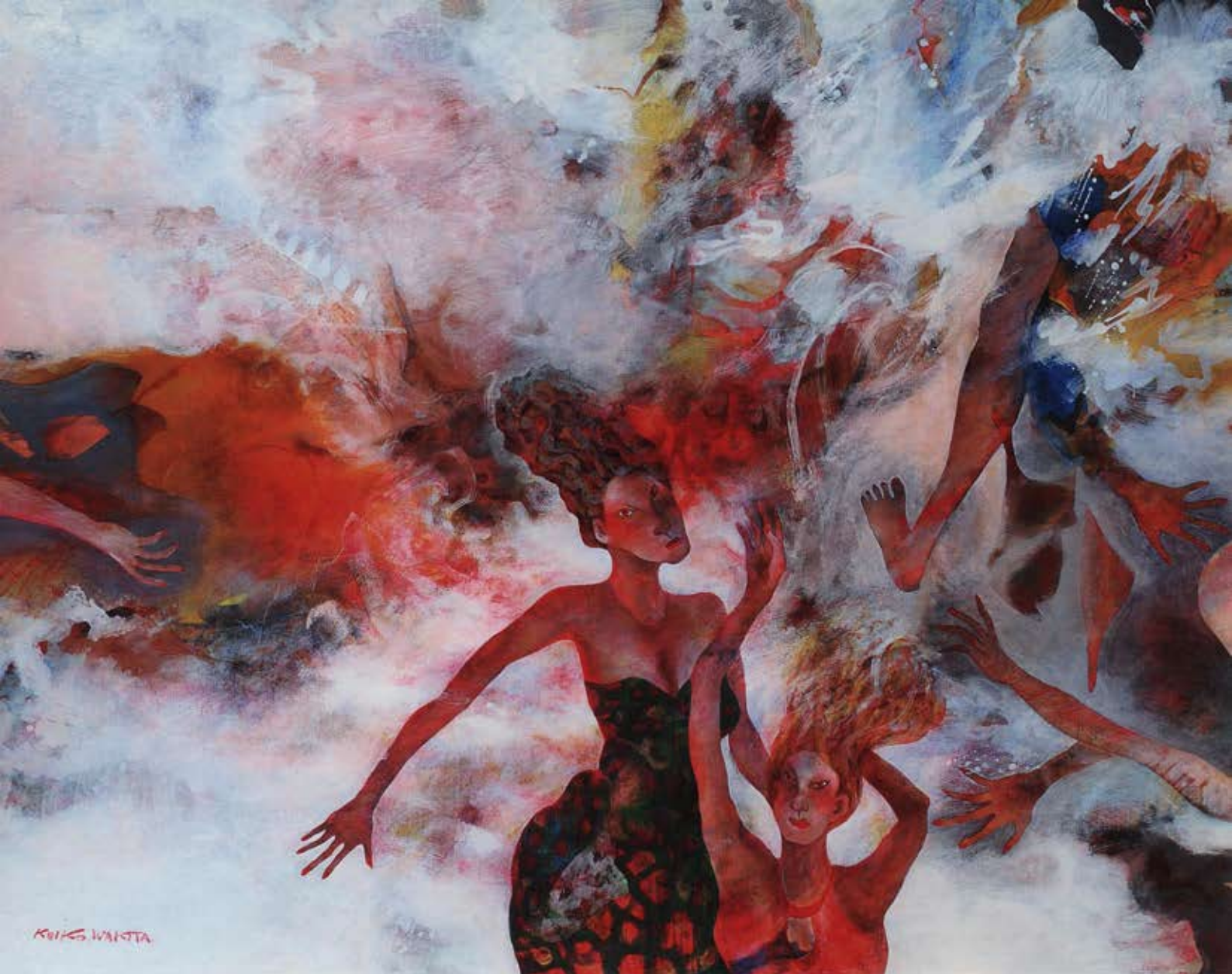
「女(1)」油彩 182×227 2008年