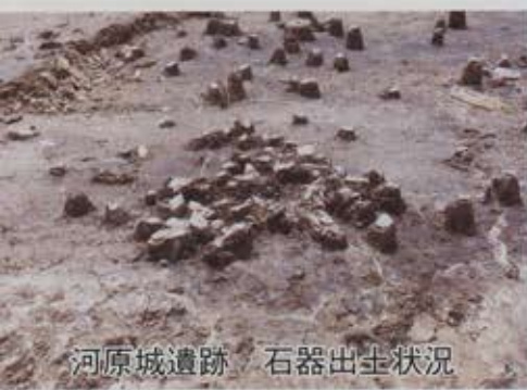
河原城遺跡 石器出土状況