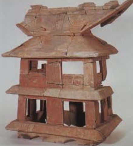
美園古墳 家形埴輪