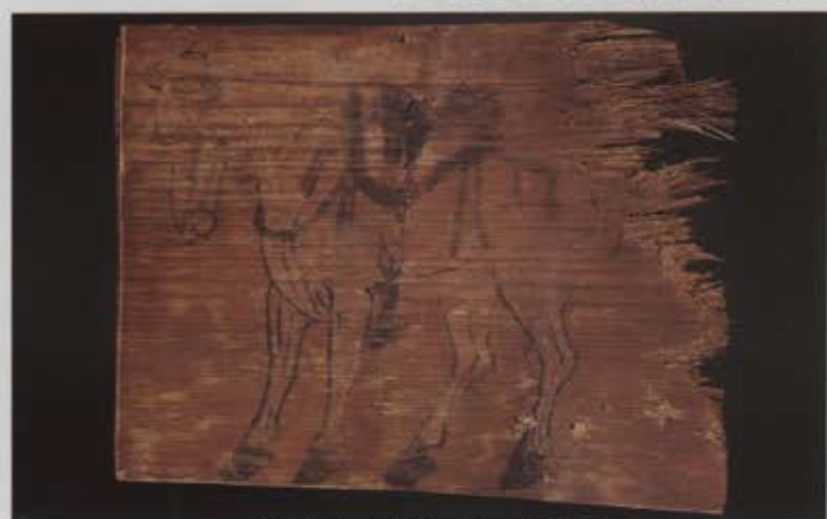
讃良郡条里遺跡 絵馬 2