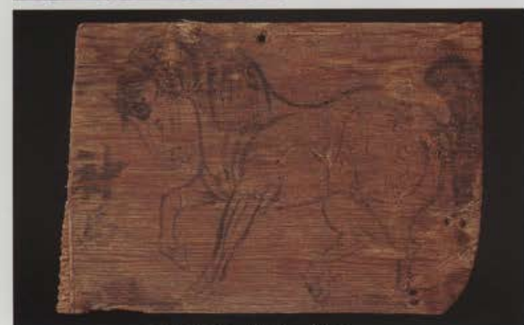
讃良郡条里遺跡 絵馬 1