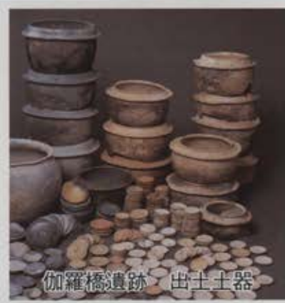
伽羅橋遺跡 出土土器