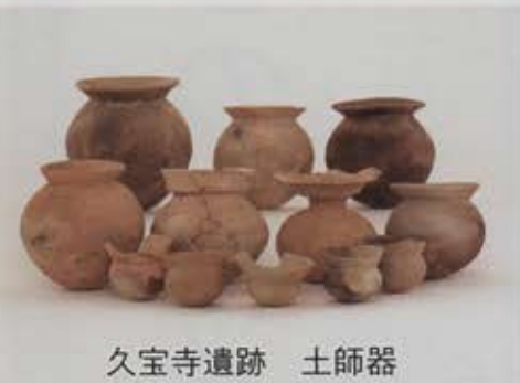
久宝寺遺跡 土師器